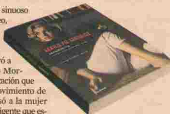
* FRAGMENTOS Autora Marilyn Monroe Editorial Setx Barral Páginas 272 Precio 28 euros

Convertida en sinuoso objeto de deseo, rubia y curvilínea carnalidad, Marilyn Monroe enterró a Norma Jeane Mortenson. La tentación que vivía en el movimiento de caderas eclipsó a la mujer sensible e inteligente que escribía poemas y garabateaba cuadernos que nunca acababa. "La vida es una sola y nos obliga a ser una sola cosa, la que los demás piensan que somos". Así escribe el italiano Antonio Tabucchi en el prólogo a Fragmentos , los poemas, notas personales y cartas de esa mujer que los poderosos estudios cinematográficos de los 50 imaginaron radiante y atolondrada; una rubia tonita y explosiva. La mujer perfeccionista, melancólica, decepcionada y despierta fue engullida por lo que los demás pensaron que era. Este libro lo componen