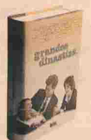
* GRANDES DINASTIAS Editorial Plaza & Janés Páginas 688 Precio 18,90 euros

Escribió Tolstói en Ana Karenina que "todas las familias felices se parecen, pero las infelices lo son cada una a su manera". Las 25 familias de este libro también perfilan sus claroscuros a su manera. Deslumbró la fortuna de los Rockefeller o los Rothschild, los Tiffany y los Thyssen, los Vanderbilt o los Trump, pero también se dibujan sus sombras, secretos y enfrentamientos sin cuartel. Otras están asociadas a imperios empresariales como los Agnelli, sinónimo de Fiat; los Gucci, los Versace o los Hilton. El brillo del cine es cosa de los Chaplin, los Douglas y los Barrymore; otras viven del arte de los toros, los Rivera Ordóñez, o de los toros y otras artes, como los Dominiguin-Bosé. Los Bush lucharon desde los años 30 del siglo pasado por controlar el mundo, con su idea redentora de la humanidad. También los Kennedy son el po-