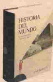
* HISTORIA DEL MUNDO Autor John Morris Roberts Editorial Debate Páginas 1.223 Precio 44,90 euros

El mundo en sus manos... y en 1.223 páginas. Las que abarca la obra excepcional de un prestigioso historiador británico, John Morris Roberts (1928-2003), llamado "el maestro de la gran panorámica". Y esto es su Historia del mundo , un compendio de la historia universal y de las civilizaciones desde nuestros orígenes en las sabanas de África hasta el mundo que surge del derrumbe de las Torres Gemelas. Roberts describe con rigor los procesos históricos y las civilizaciones, pero los entretiene con el arte, las religiones, los avances científicos y el devenir económico. Todo está relacionado, y eso es lo que da relevancia a este fresco de la historia humana, el impacto de los hechos y de cada paso adelante de esta crónica de la humanidad. El año en que murió, Morris, un erudito con enorme capacidad divulgadora, como demuestran sus magníficos documentales pa-