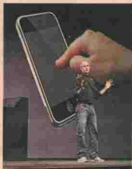
Steve Jobs presenta el 'iPhone' (2007).

Han pasado diez años y el mundo tembló ante las cenizas de las Torres Gemelas y la guerra interminable en Irak y