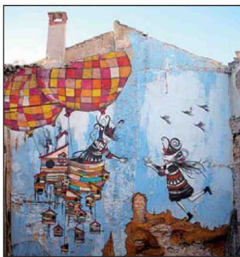
Skount ▲ "Seres de leyenda, bufones de una corte malograda, ideales carnavalescos para mostrar la realidad y la opresión del hombre. Eso es lo que prolifera en la obra de Skount (Cádiz, 1985)", dice Suárez. Visita skount-works.blogspot.com . SKOUNT