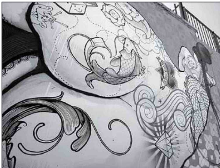
BoaMistura ▲ "Colectivo de artistas madrileño formado por cinco miembros que lleva trabajando desde 2001. Saltaron a la fama internacional cuando en 2009 trabajaron en un mural, 'Die Umarmung' (El abrazo, frente al muro de Berlín". Usan aerosoles, pintura plástica, rotuladores, tizas, carteles... En la foto: 'Fat Stylo'. Más de su obra en boamistura.com. BOAMISTURA