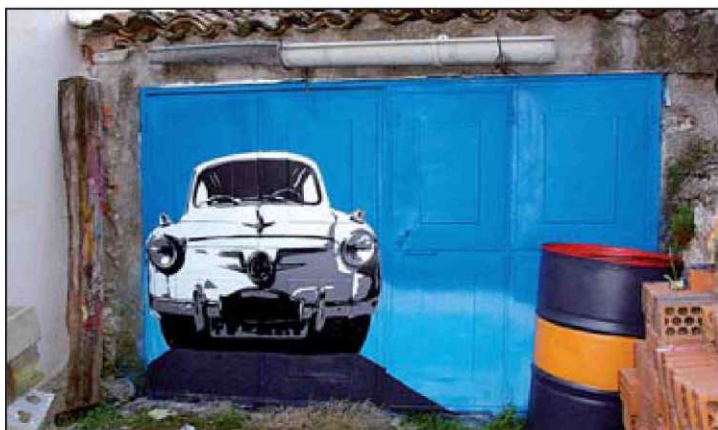
Padu ▲ "Influenciado por el graffiti autóctono de los ochenta, Muelle, Remebe y los flecheros, su obra (arriba la titulada '600') derivaría en lo figurativo. Padu (Madrid, 1979) lleva trabajando en la calle desde 2007 y tiene una estética pop". Más imágenes en flickr.com/photos/padu-madrid. PADU