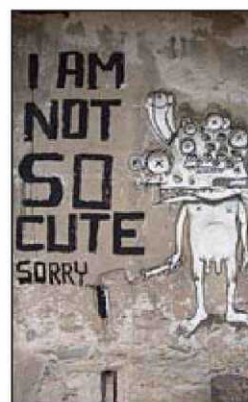
Rallito X ▲ "Este artista (Barcelona, 1977) es uno de los nom- bres que deberíamos memorizar si tuviéramos que hablar de ar- te urbano dentro de 10 años. Ha creado un imaginario puro, úni- co". Mira sus obras en rallitox.org . RALLITO X