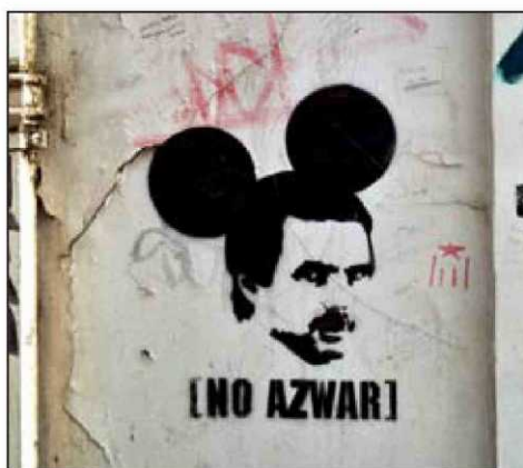
Noaz ▲ "Comenzó en 2003, por las manifestaciones contra la guerra de Irak. Noaz (Madrid, 1978) ha creado un estilo definido ba- sado en plantillas y personajes de la vida política que salpican men- sajes con crítica social". Más en flickr.com/photos/noazmadrid . NOAZ

la historia del graffiti en España desde los pioneros ctivos actuales que ha enriquecido la expresión artística museos. destaca a un grupo de esos creadores.