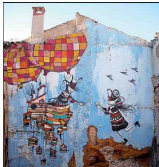
Skount ▲ "Seres de leyenda, bufones de una corte malograda, ideales carnavalescos para mostrar la realidad y la opresión del hombre. Eso es lo que prolifera en la obra de Skount (Cádiz, 1985)", dice Suárez. Visita skount-works.blogspot.com . SKOUNT