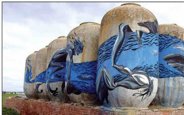
Laguna ▲ "La naturaleza, su abstracción extrema y un lenguaje propio de novelas de ciencia ficción" (Ciudad Real, 1979). "Lleva pintando desde 1997 y tiene en el 3D y en su sabio uso de los diferentes volúmenes an muros u objetos, una de sus grandes diferencias creativas", explica el autor del libro 'Los nombres ese graffiti español'. Arriba: 'Big hunting, Almagro. 2001'. Una muestra de su trabajo puede verse en laguna6.