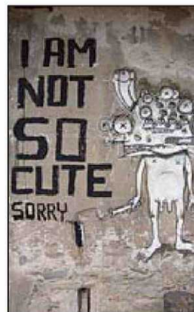
Rallito X ▲ "Este artista (Barcelona, 1977) es uno de los nombres que deberíamos memorizar si tuviéramos que hablar de arte urbano dentro de 10 años. Ha creado un imaginario puro, único". Mira sus obras en rallitox.org . RALLITOX