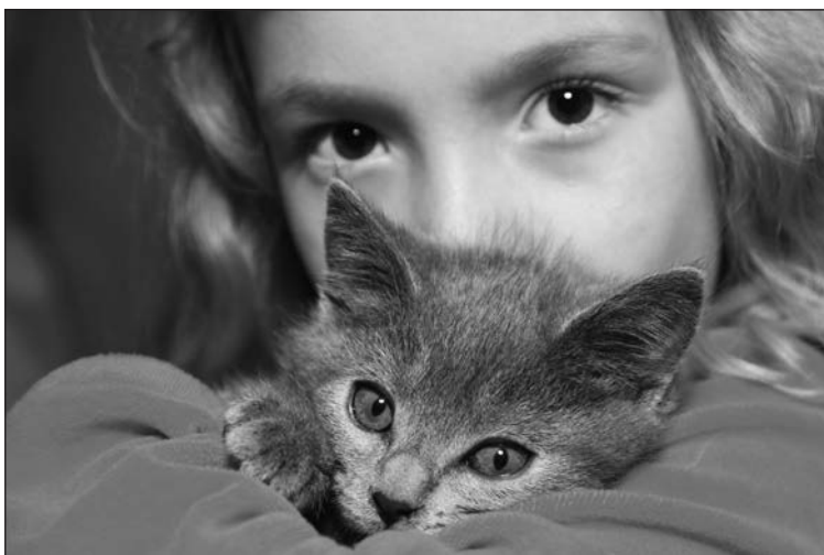
FIGURA 1-3: Aunque los gatos a veces parezcan distantes, buscan compañía.

La mayoría de los gatos abandonados se une a las lastimeras filas de los gatos salvajes (animales que vuelven a un estado semisalvaje) o van a parar al refugio de animales, donde los sacrifican.