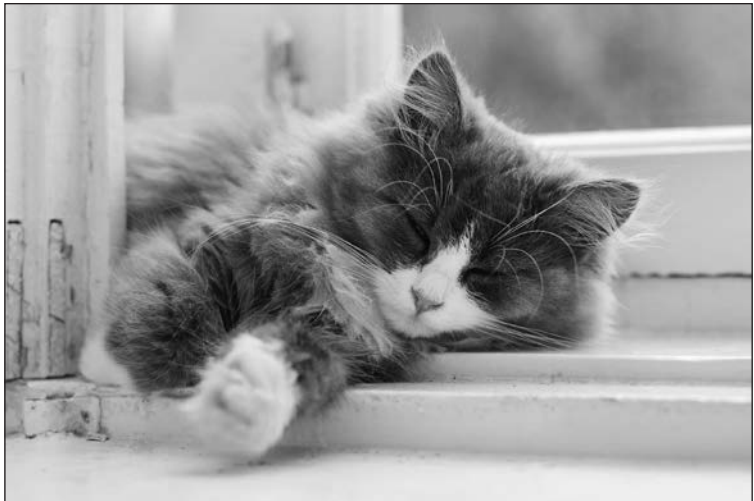
FIGURA 1-4: Debes decidir si tu gato va a vivir únicamente dentro de casa, o si podrá salir y entrar a su antojo.

Encontrarás más información sobre cómo tener un gato casero y feliz en los capítulos 8 y 22.