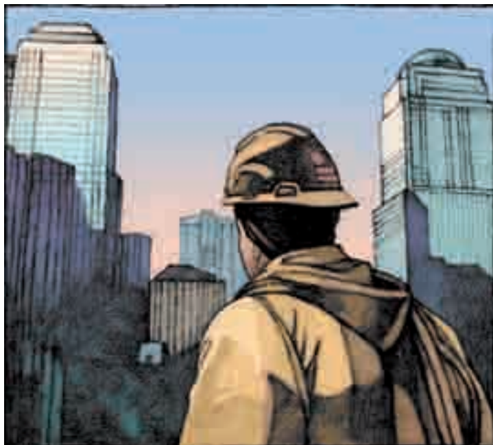
La Zona Cero en obras, rodeada de los edificios del Financial District