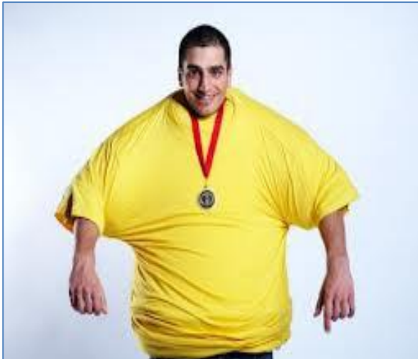
Más camisetas puestas en un minuto