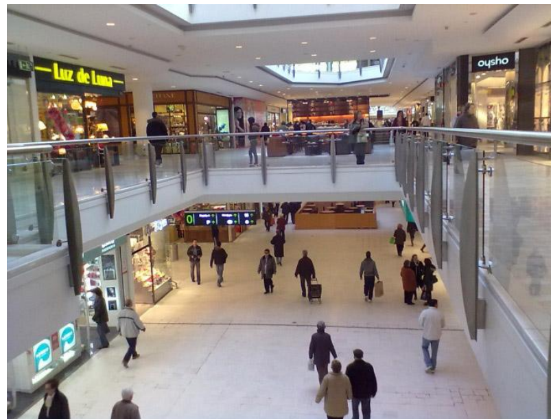
Imagen interior del CC La Vaguada

Madrid es la ciudad escogida para celebrar el Día Internacional de los Récords. El centro comercial La Vaguada, situado en el barrio del Pilar, acogerá el evento en su espacio SA-1, un lugar de paso para los visitantes, la mayoría familias, que podrán acercarse y participar gratuitamente.